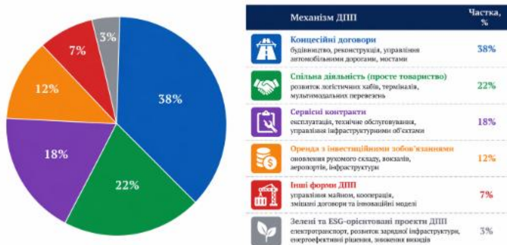
Рис. 2. Структура застосування механізмів державно-приватного партнерства у розвитку транспортної інфраструктури на засадах ESG

У практиці реалізації проєктів державно-приватного партнерства транспортний сектор традиційно посідає провідне місце, оскільки саме в цій сфері зосереджена значна частина інфраструктурних інвестицій. Різні сегменти транспортної системи характеризуються відмінною структурою використання партнерських механізмів, що пов'язано з особливостями інвестиційних потреб, технологічних параметрів інфраструктури та моделей управління об'єктами. Узагальнена структура застосування основних механізмів державно-приватного партнерства у транспортному секторі представлена на рис. 2.