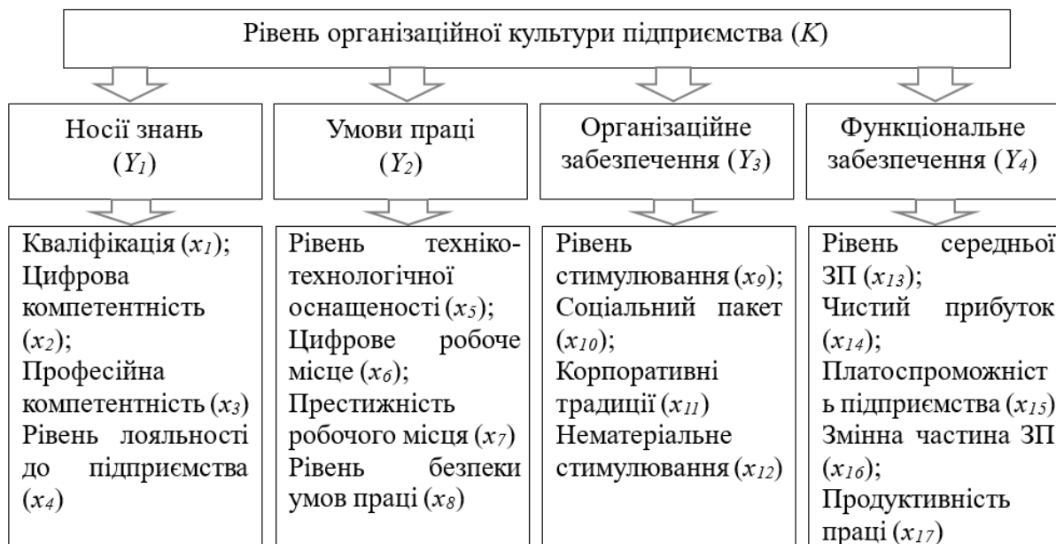
Рис. 1. Система показників оцінки рівня організаційної культури підприємства