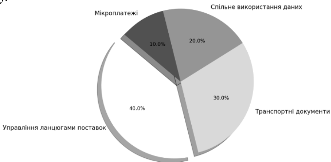
Рис. 1. Застосування блокчейн-технологій у транспортній інфраструктурі

Зосередимось на більш детальному аналізі використання блокчейн саме у транспортній інфраструктурі (рис. 2). Відобразимо ключові сфери впровадження блокчейн від управління ланцюгами поставок до мікро платежів. Такий підхід дозволив глибше зануритися в специфіку застосування блокчейн в транспорті, визначаючи потенційні напрямки для подальших досліджень та розвитку.