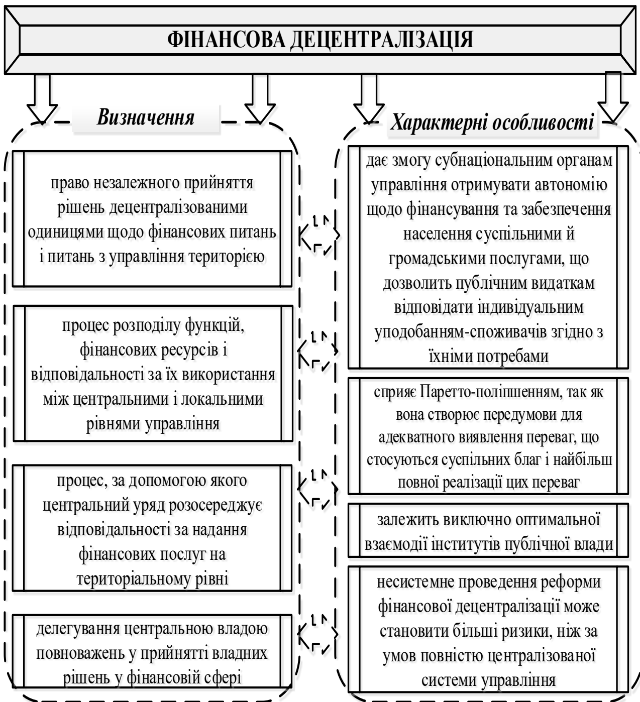
Рис. 1. Підходи щодо визначення поняття «фінансова децентралізація»