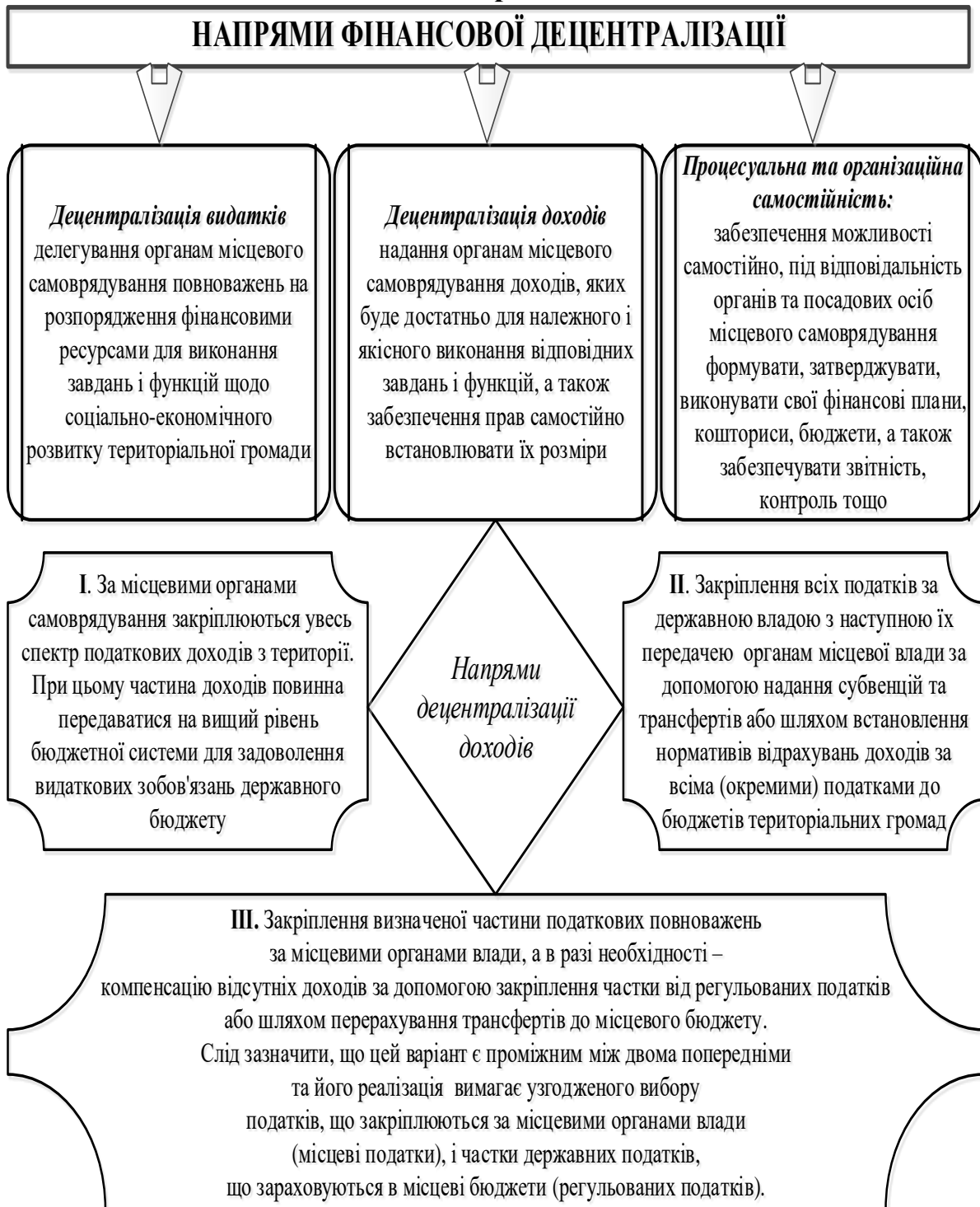
Рис. 2. Загальні напрями впровадж

та функціонування інституту фінансової децентралізації