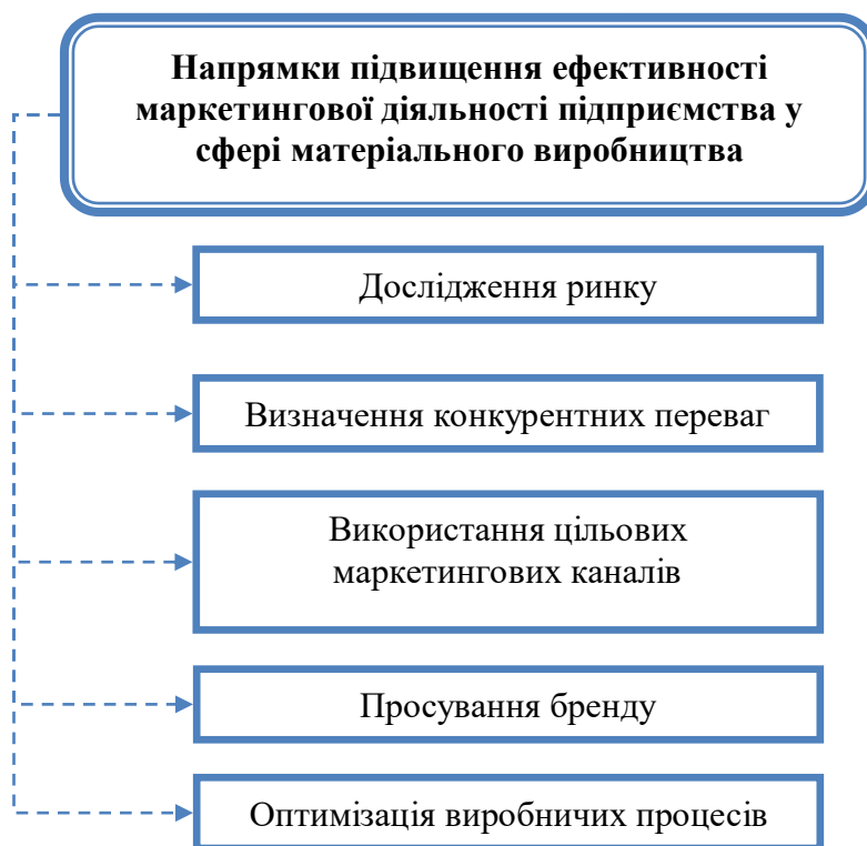
Рис. 2. Напрямки підвищення ефективності маркетингової діяльності підприємства у сфері матеріального виробництва

Розглянемо означену проблему в умовах підприємства матеріальної сфери виробництва [9-11]. Перелік напрямків, які можуть допомогти підвищити ефективність маркетингової діяльності підприємства у сфері матеріального виробництва, зазначений на рис. 2.