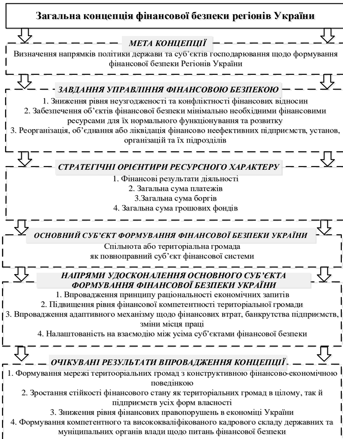
Рис. 2. Концепція фінансової безпеки регіонів України