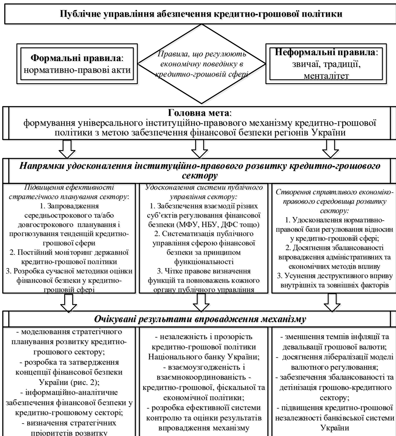
Рис. 3. Вдосконалення інституційно-правового механізму кредитно-грошової політики забезпечення фінансової безпеки