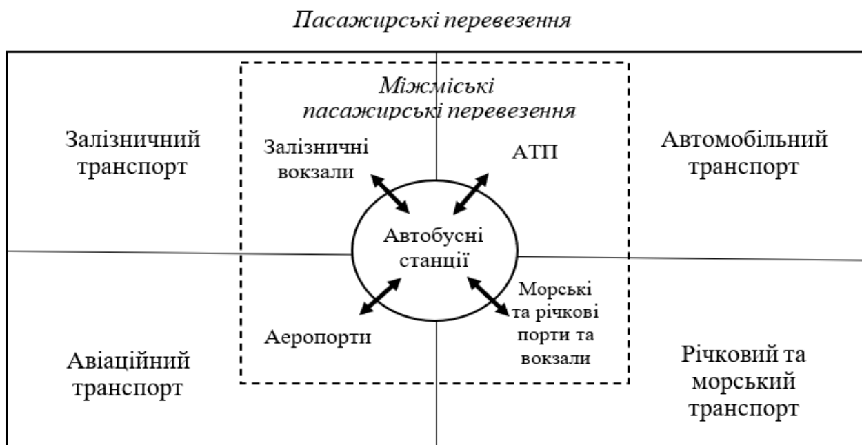
Рис. 1. Модель діяльності пасажирських автобусних станцій з позиції системного підходу

Виклад основного матеріалу дослідження. Початковим етапом цих досліджень є виявлення місця та ролі пасажирських автобусних станцій у загальній системі пасажирських перевезень (тобто встановлення та формування їх місці). Для цього з позицій системного підходу розглянемо діяльність автостанцій (рис. 1).