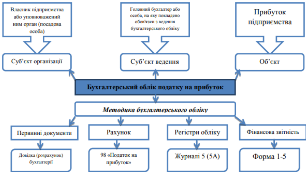
Рис. 1. Організація і методика бухгалтерського обліку податку на прибуток