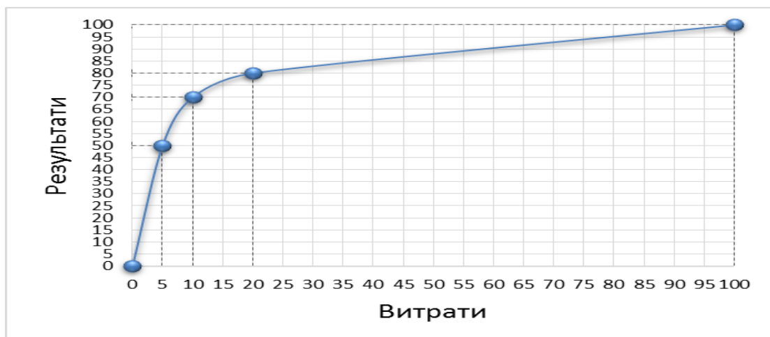
Рис. 2 - Необмежені можливості логістики після відкриття ОЗЛ

Це був значний прорив в напрямку розширення можливостей логістики. На відміну від лише трьох дискретних значень співвідношення затрат і результатів, трьох приватних законів логістики (20-80, 10-70, 5-50) він встановив суцільну залежність результатів від затрат у всьому їх діапазоні (від 0% до 100%). Рис. 2 наочно підтверджує ці ствердження.