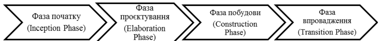
Рис. 2. Стадії життєвого циклу процесу створення архітектури інноваційного простору

Система науки та освіти як складова архітектури інноваційного простору підприємницької діяльності враховує в собі не лише знання, які персонал отримав в закладах освіти, а й внутрішню наукову діяльність та освітні програми для працівників підприємства. Процес створення архітектури інноваційного простору підприємства передбачає розподіл цього процесу за стадіями життєвого циклу (рис. 2).