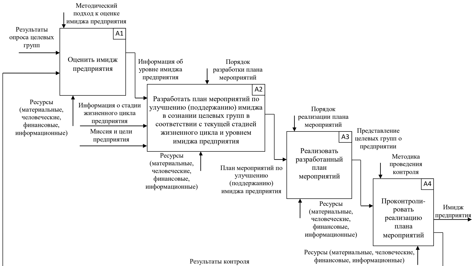
Рис. 3. Декомпозиционная диаграмма процесса формирования имиджа предприятия первого уровня (на стадии роста и зрелости жизненного цикла)