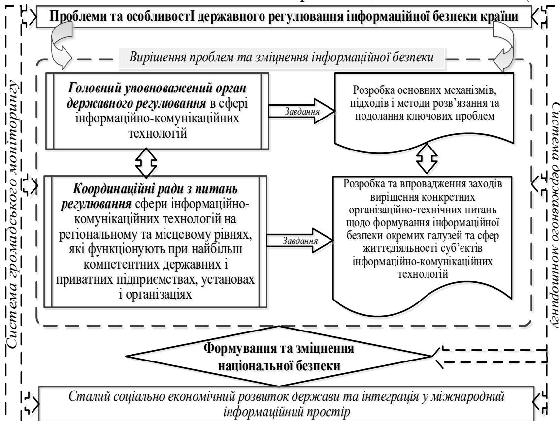
Рис. 3. Механізм вирішення проблем державного регулювання у сфері інформаційно-комунікаційних технологій

Для здійснення загальної координації вирішення зазначених проблем має ефективно функціонувати відповідна уповноважена державна структура з питань інформаційної безпеки, яка б визначала конкретні підходи та методи їх вирішення та подолання. Водночас пропонується запровадити мережу координаційних рад, які діятимуть на найбільш компетентних державних і приватних підприємствах, установах та організаціях. Основним завданням цієї мережі координаційних рад буде вирішення конкретних організаційно-технічних проблем у сфері формування інформаційної безпеки в окремих галузях і сферах життєдіяльності суб'єктів інформаційно-комунікаційних технологій з метою посилення загального рівня національної безпеки. (Рис. 3).