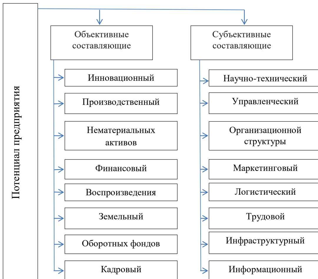
Рис. 3. Составляющие экономического потенциала предприятия

Субъективные составляющие потенциала предприятия связаны с общественной формой их обнаружения. Они не потребляются, а составляют предпосылку, общеэкономический, общехозяйственный социальный фактор рационального потребления объективных составляющих (рис. 3).